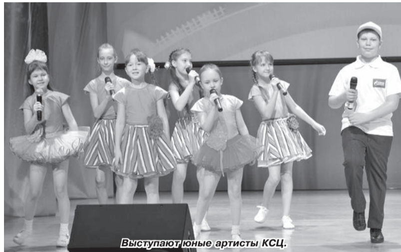
Выступают юные артисты КСЦ.